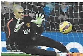
Ofrecen a Víctor Valdés como sustituto de Iker Casillas en el...

Apuntándose al 'Torneo Solidario de Volley Playa' organizado por Philips, se colabora en la creación de una sala para los padres de los niños ingresados en el Hospital 12 de Octubre de Madrid. Un lugar donde puedan recibir la información de los médicos y el apoyo psicológico y emocional que necesitan.