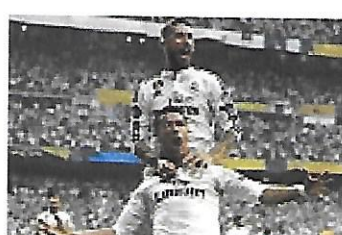
El Real Madrid filtra que desea ver a Ramos y Cristiano como sus nuevos...