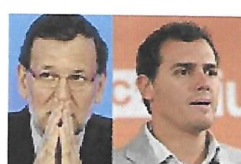
El bipartidismo repunta, Podemos se hunde y la unión PP-Ciudadanos...