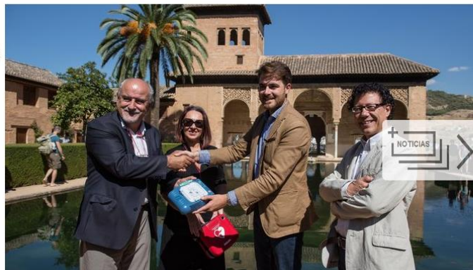
Philips y la Asociación España Salud completan la cardioprotección de la Alhambra MADRID | EUROPA PRESS